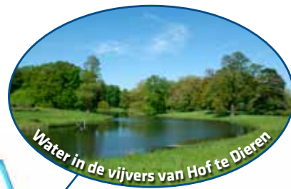
Water in de vijvers van Hof te Dieren