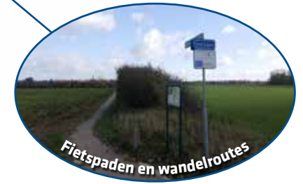
Fietspaden en wandelroutes