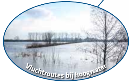
Vluchtroutes bij hoogwater